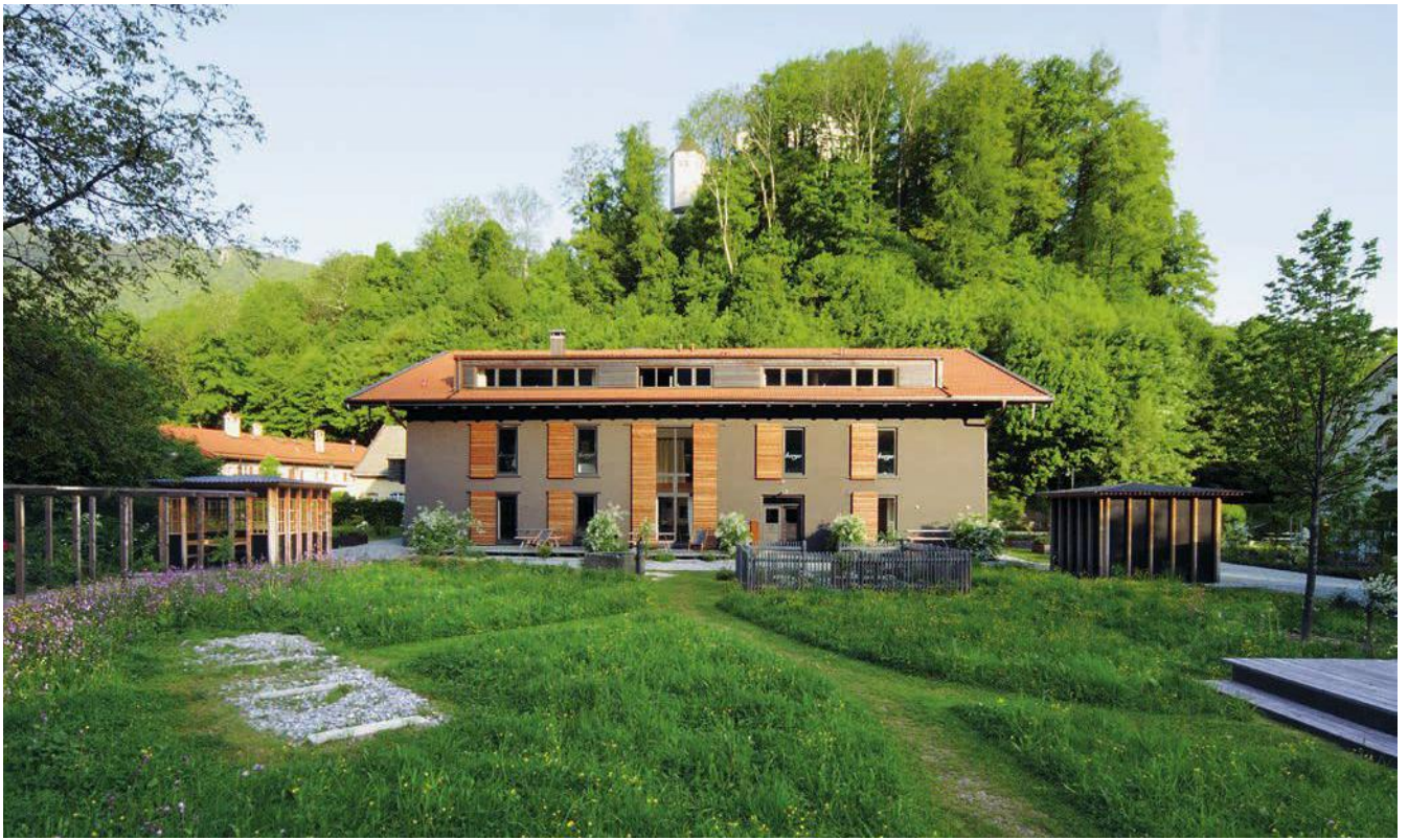
berge: puristische Herberge in Aschau im Chiemgau