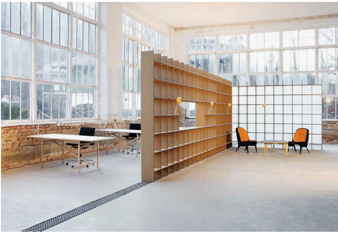
Regalsystem FNP Foto: Jäger & Jäger