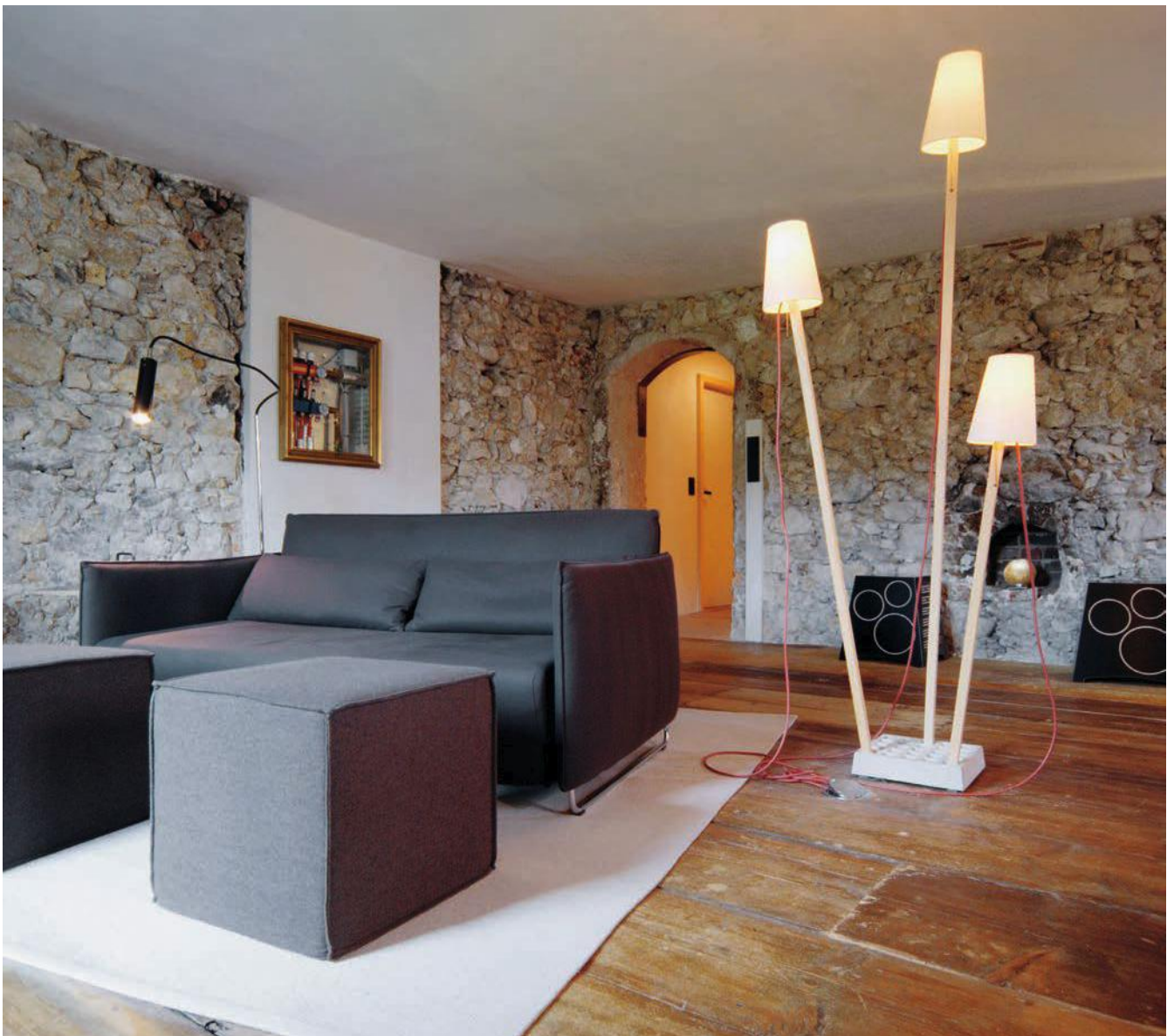
berge: Liftstube Wohnzimmer