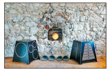
Die Hocker – designed von Nils Holger Moormann.