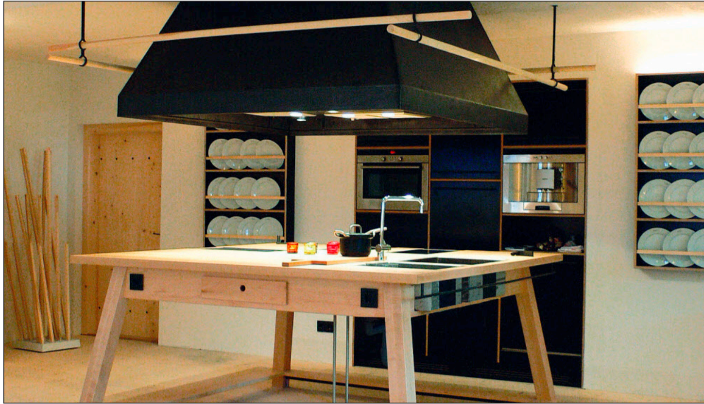
Gemütlichkeit auf hohem Niveau: in der Gemeinschaftsküche lässt sich's wohl sein.