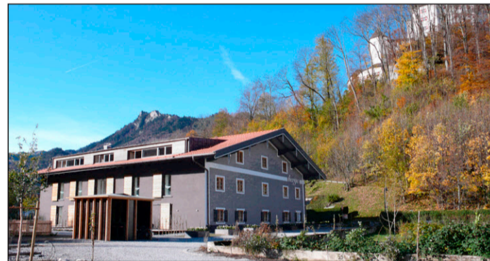
In diesem Haus aus dem 17. Jahrhundert logieren die «Berge»-Gäste.

Moormann verwendete für den Ausbau nur Naturmaterialien, von heimischen Handwerkern verarbeitet. Er wollte mit «Berge» einen «Ort für geistige Wellness» schaffen, sagte er gegenüber dem Magazin «Architekt & Wohnen». Die Zimmer sind schlicht, ohne Schnickschnack, doch trendig und originell eingerichtet. Mit Holzmöbeln, die der Herr des Hauses entworfen hat. Die «Bergbude» beispielsweise bietet sechs Schlafplätze in Etagenbetten. Im «Gipfelstürmer» mit Dachschräge indes, kann sich der Gast vertun: er verfügt dort über 140 Quadratmeter Raum. Die Zimmer sind mit Spülmaschine, zwei Kochfeldern, Kühlschrank, Essgeschirr, Besteck und Pfannen ausgestattet. Gekocht werden kann auch in der Gemeinschaftsküche. In den Bä-