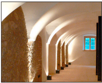
Die Eingangshalle führt in die Moormannsche Her-Berge.