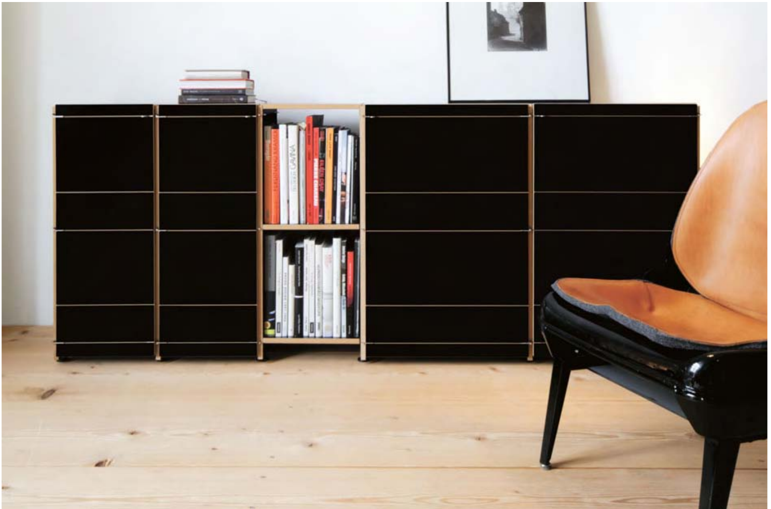
K1 Sideboard von Neuland | Paster & Geldmacher (2014) . K1 Sideboard by Neuland | Paster & Geldmacher (2014)