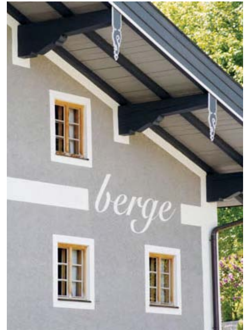
Gästehaus berge von Nils Holger Moormann (2008) . Guest house berge by Nils Holger Moormann (2008)