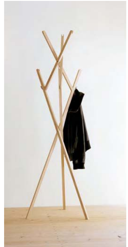
Hutständer Hut ab von Konstantin Grcic (1998) . Hat stand Hut ab by Konstantin Grcic (1998)