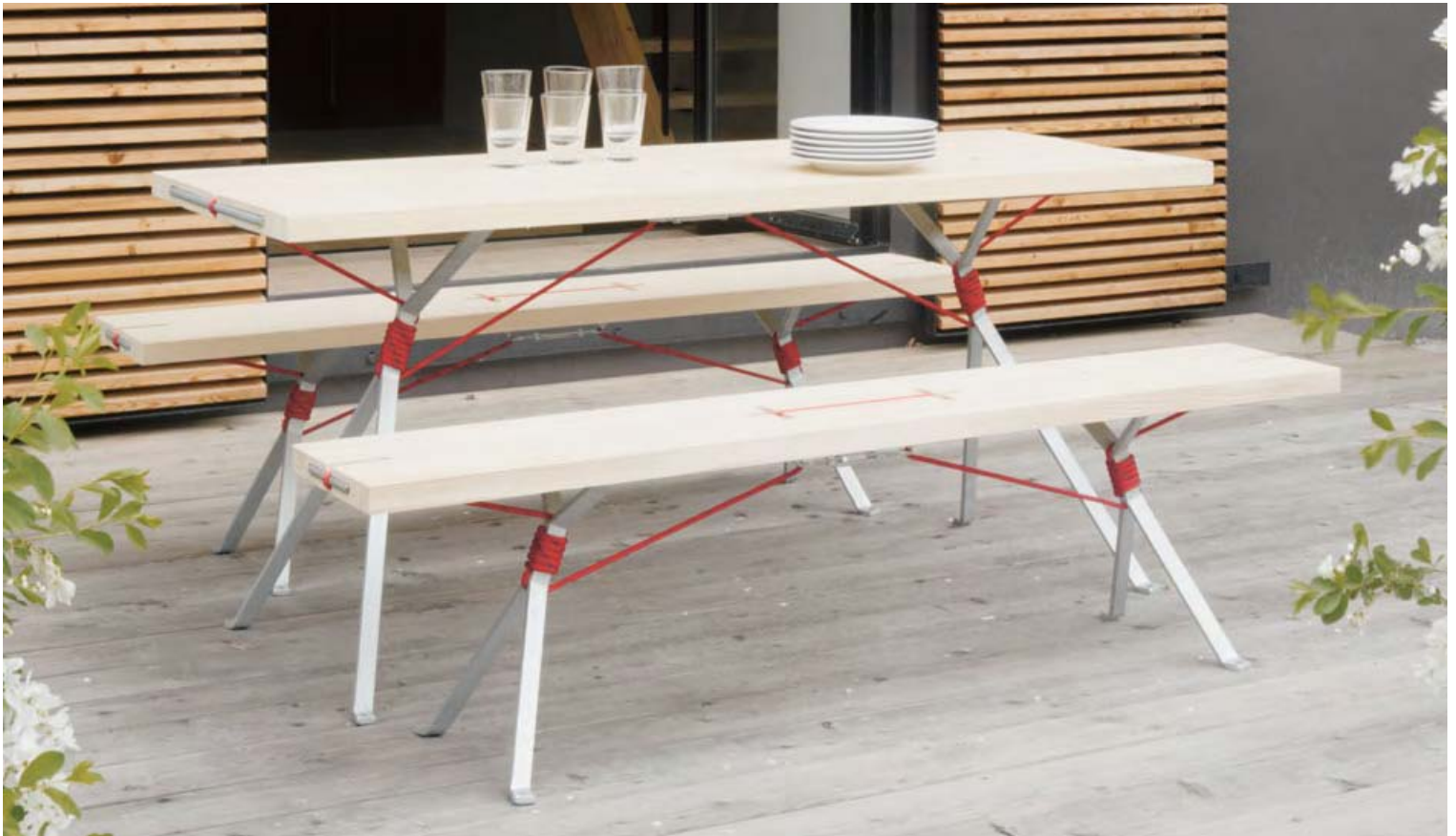
Tischsystem Kampenwand von Nils Holger Moormann (2009) . Table system Kampenwand by Nils Holger Moormann (2009)