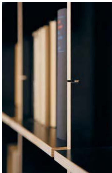
Regalsystem FNP von Axel Kufus (1989) . Shelf system FNP by Axel Kufus (1989)