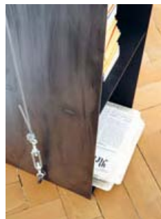
Gespanntes Regal von Wolfgang Laubersheimer (1984) . Shelf Gespanntes Regal by Wolfgang Laubersheimer (1984)