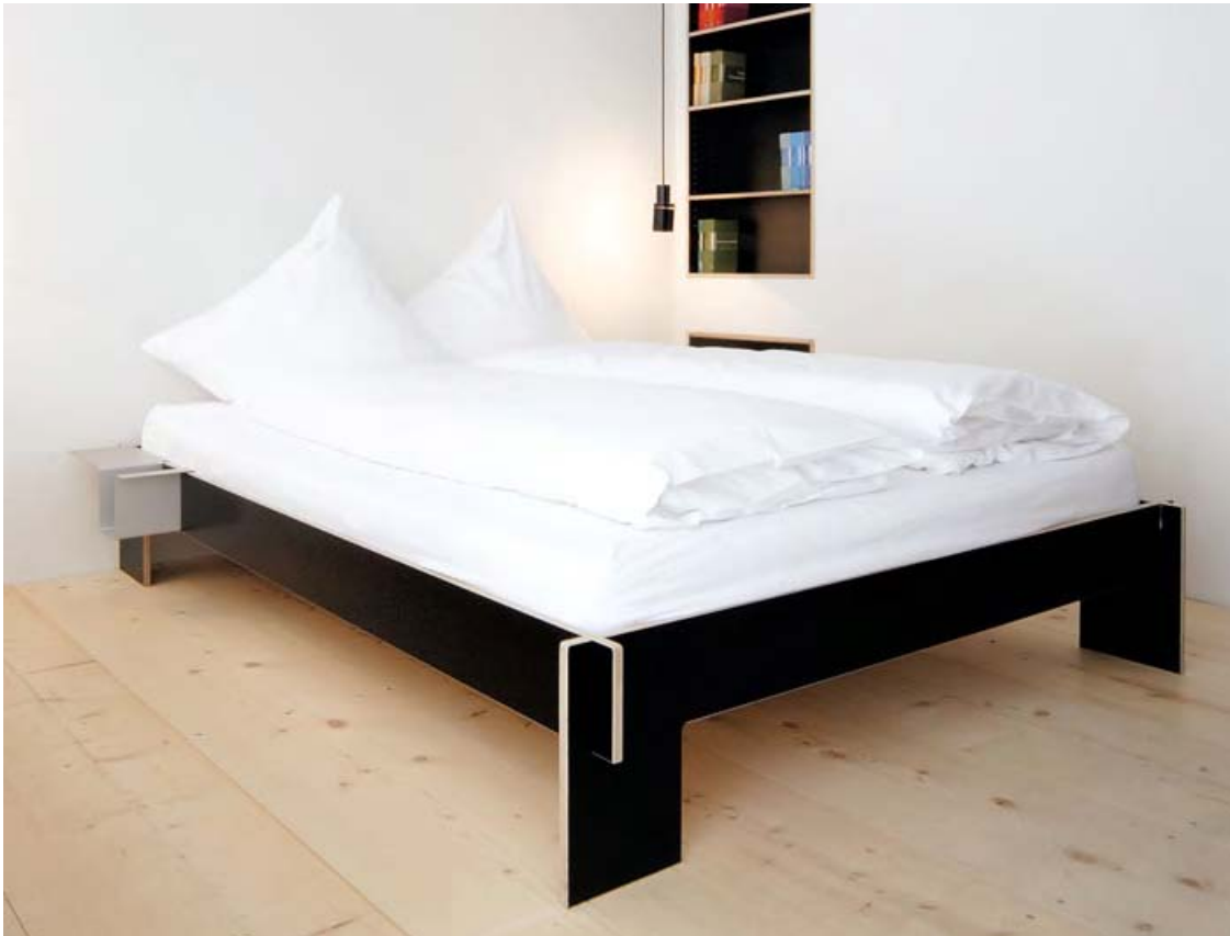
Bett Siebenschläfer von Christoffer Martens (2007) . Bed Siebenschläfer by Christoffer Martens (2007)