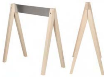
Tischbock Taurus von Jörg Sturm und Susanne Wartzack (1993) . Trestle Taurus by Jörg Sturm and Susanne Wartzack (1993)