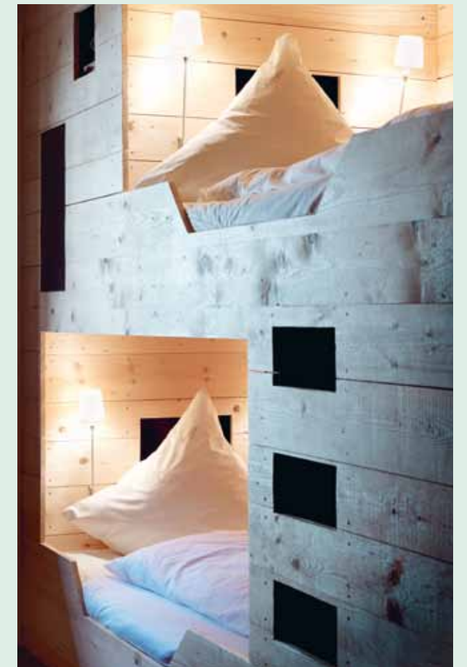
Formen und Farben sind nach dem Geschmack des Herbergsvaters, reduziert nämlich. Dennoch ist jedes Quartier in „Berge“ im besten bayerischen Sinne saugemütlich.